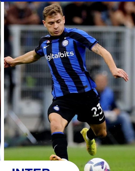
PORTO - INTER