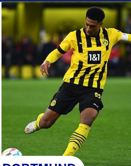
CHELSEA - B.DORTMUND