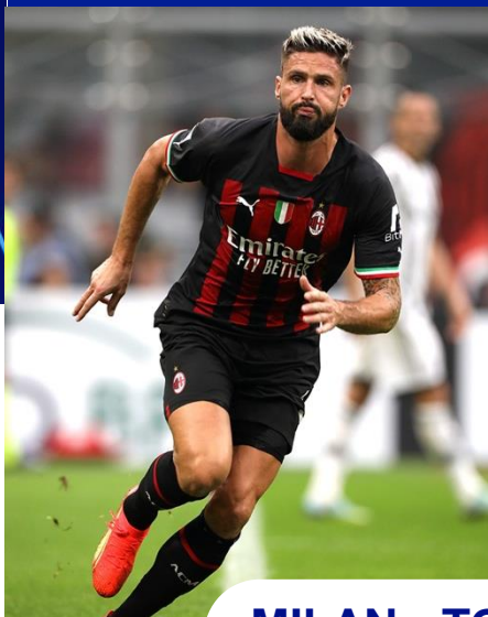
MILAN - TOTTENHAM