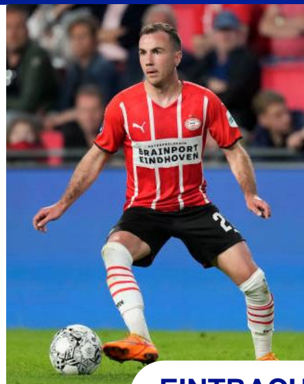
EINTRACHT - NAPOLI